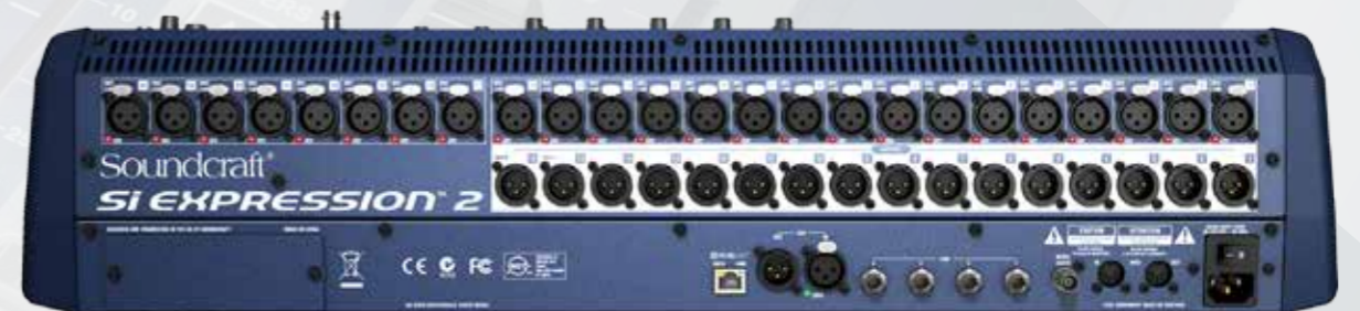
Si Expression 2 背面板